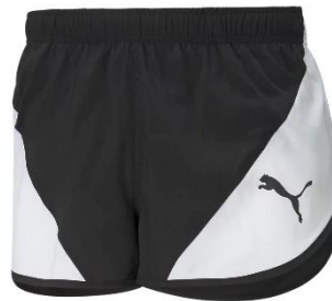
Split Short M 520350-01 Größe: S – 3XL 25,50 € Split Short W 520351-01 Größe: XS - XXL