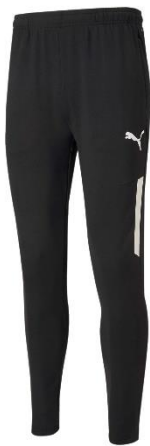
Training Pants Pro 657332-01 Größe: S – 3XL Damen siehe Youngsters