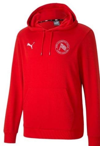
Casual Hoodie Y 658619-01 37,00 € Größe: 128 -164