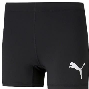
Short Tight W 519671-01 22,50 € Größe: XS – XXL