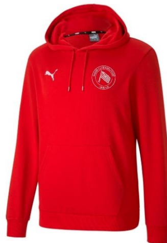
Casual Hoodie 656580-01