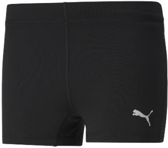
Short Tight WY 519673-01 22,50 € Größe: 128 -164