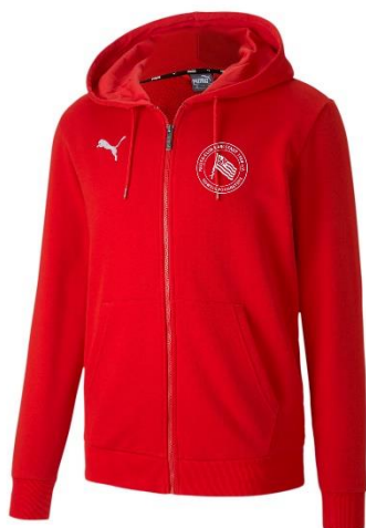
Casual Hooded Jacket Y 658596-01 40,00 € Größe: 128 - 164