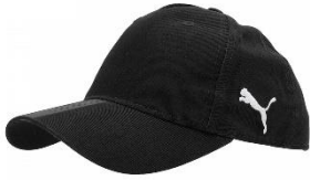
Liga Cap 022356-03 Einheitsgröße