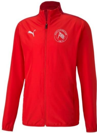
Sideline Jacket M 658622-01 Größe: S - 3XL 49,00 € Sideline Jacket W 658624-01 Größe: XS-XXL