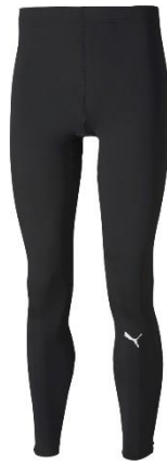
Full Tight M 519598-01 Größe: S – 3XL