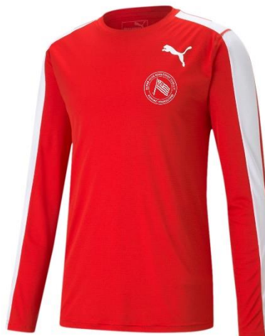
Long Jersey Y 519606-05 Größe: 128 -164