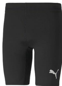
Short Tight M 519669-01 25,50 € Größe: S – 3XL