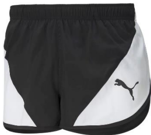
Split Short Y 520343-01 22,50 € Größe: 128 - 164