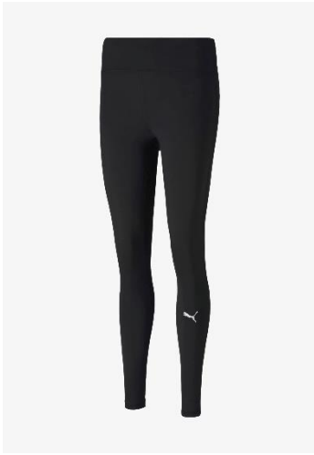
Full Tight W 519605-01 Größe: XS – XXL