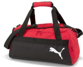
Teambag 090232-03 Größe S