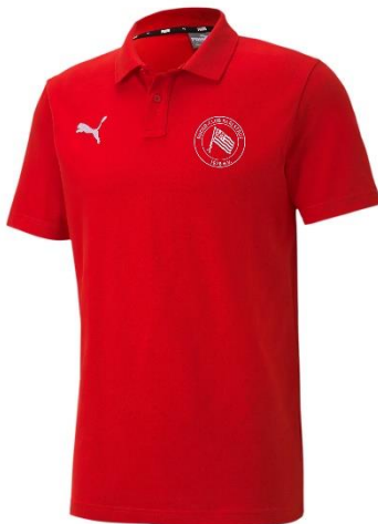
Polo Shirt M 658605-01 Größe: S – 3XL 28,00€ Polo Shirt W 658607-01 Größe: XS-XXL