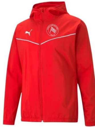
All Weather Jacket 657396-01 43,00 € Größe: S – 3XL