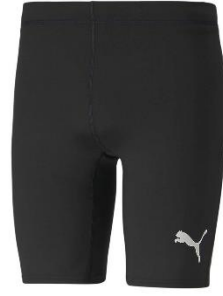
Short Tight MY 519675-01 22,50 € Größe: 128 -164