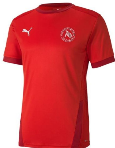
Short Jersey Y 705748-01 Größe: 128 -164