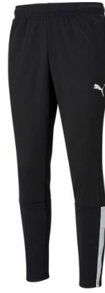
Training Pants Pro Y 657335-03 31,50 € Größe: 152 - 176 Auch für Damen geeignet: Damengröße S entspricht 164