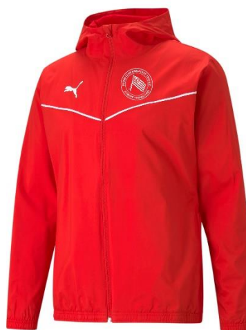
All Weather Jacket Y 657402-01 38,00 € Größe: 128 - 164