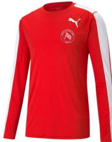
Jersey Long M 519590-05