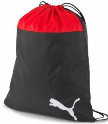
Gym Sack 090240-03 Einheitsgröße