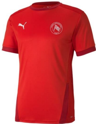
Jersey Short M 705747-01