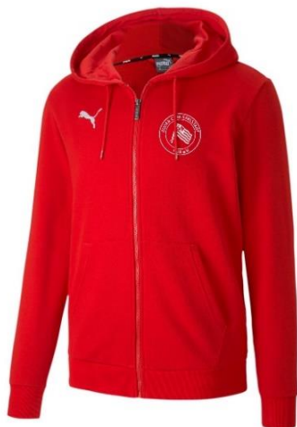
Casual Hooded Jacket 658595-01