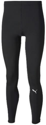
Full Tight Y 519613-01 31,50 € Größe: 128 - 164