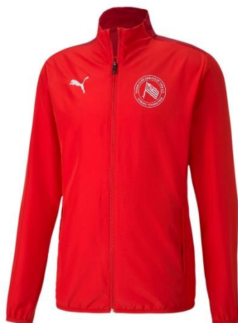
Training Jacket Y 658634-01 Größe: 128-164